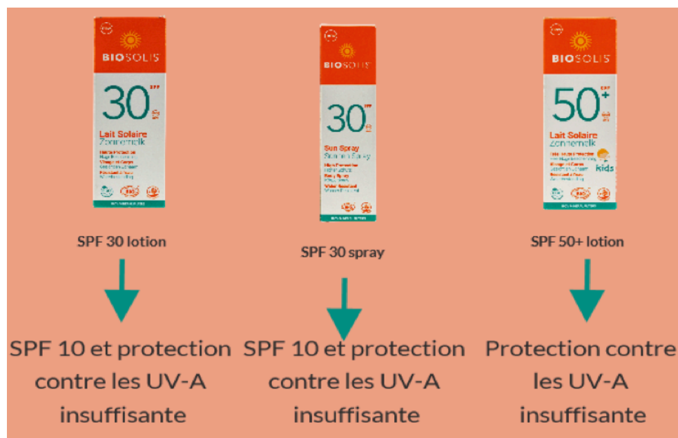
Schéma d'analyse des résultats obtenus

* source: 2022; Les crèmes solaires de Biosolis ne tiennent pas leur promesse ; https://www.test-achats.be/sante/sante-au-quotidien/produits-testes/news/creme-solaire-biosolis